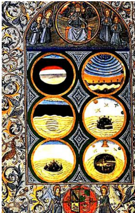
La Création du monde en six jours