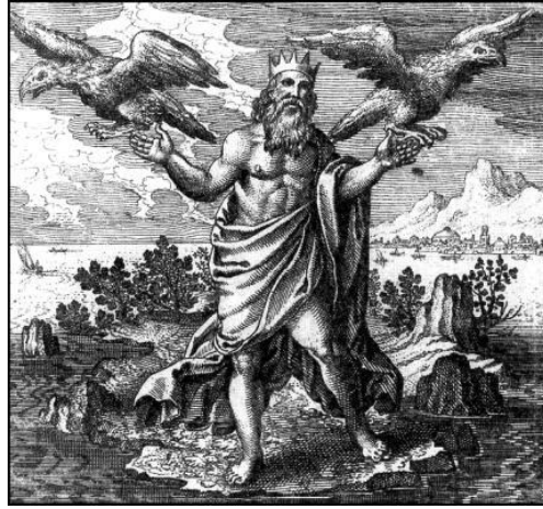
Une image de Jupiter lâchant ses aigles dans le monde, ( Atalanta fugiens (1618), Michael Maier).

DANS NOTRE VIE : Progressons en rayonnant, dans la détente confiante. Notre espace intérieur n'est-il pas infini ? Où sont les limites entre l'intérieur et l'extérieur ?