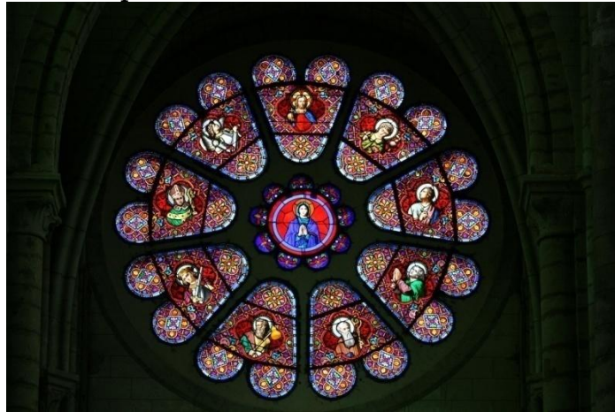
Rosace de l'église Notre-Dame de Bonneval

L'HOMME UNIVERSEL : La croix en elle-même est signe de l'homme universel : les quatre branches représentent l'ouverture de son espace intérieur et le centre désigne son cœur, son soleil intérieur, sa quintessence et le rappel de son unité. La croix est une rosace en puissance, ce que nous rappellent aussi les fleurs épanouies de la croix.